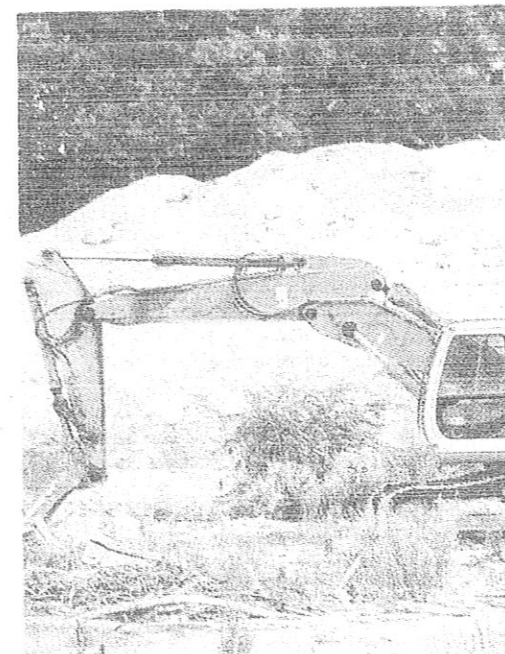
Carotaggi nell'area ex Farmoplant

re, quando deve valutare un problema o una questione, dovrebbe pensare di coinvolgere di più medici e tecnici competenti sulla questione. E invece spesso, soprattutto i medici, non vengono chiamati a quei tavoli. È un errore a mio modo